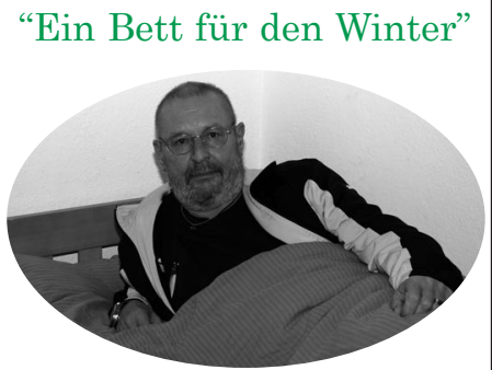
„Ein Bett für den Winter“